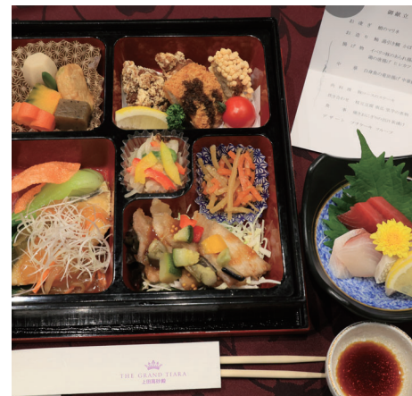
お食事もおいしくいただきました。