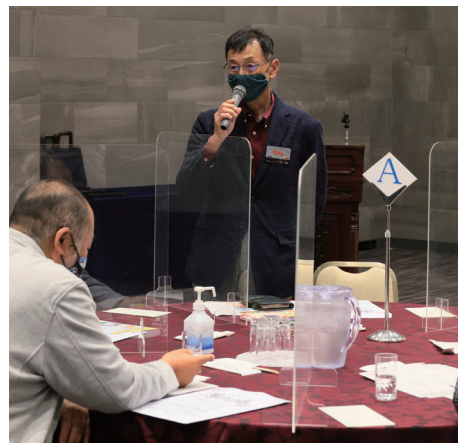
アクリル板を設置し、感染対策バッチリです！