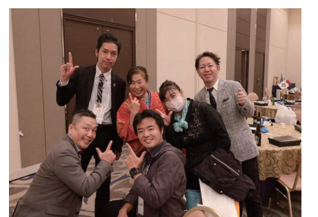
参加のみなさんで