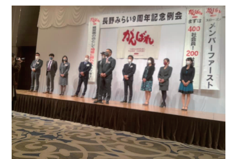
石坂新代表と新世話人の皆様