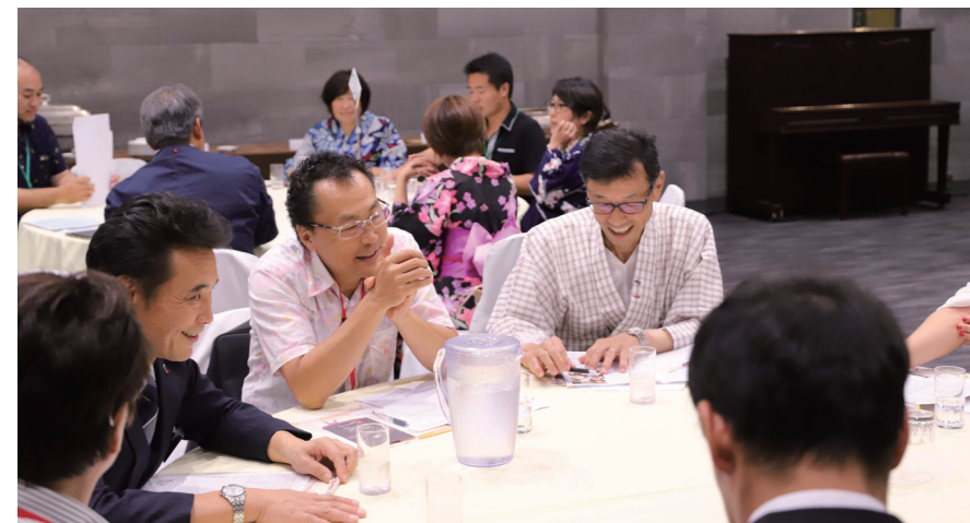
テーブル商談会、和やかにお話が弾んでいるようです。