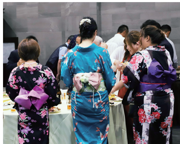
うえだは女性が多いです！