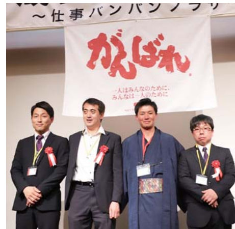
ゲストの皆さんと代表