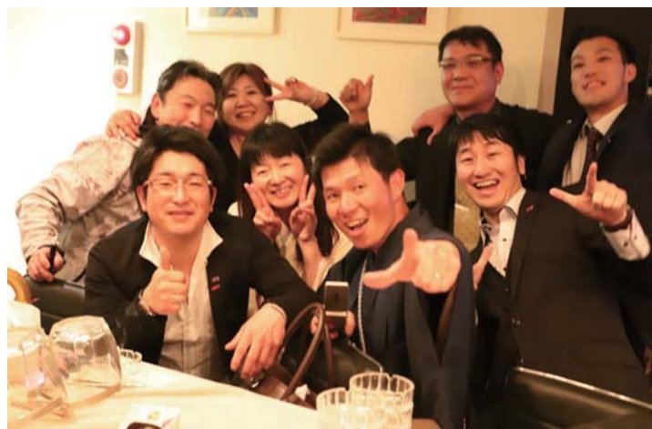
守成の醍醐味は二次会にあり。楽しそうです！