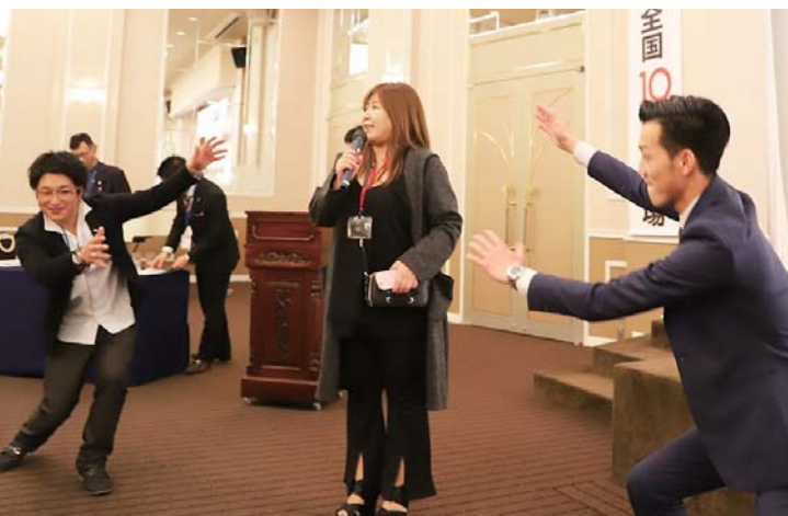
二次会はバラエティハウス舞歌さんでした