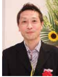
HAIR.SLUT 小胎 公啓様